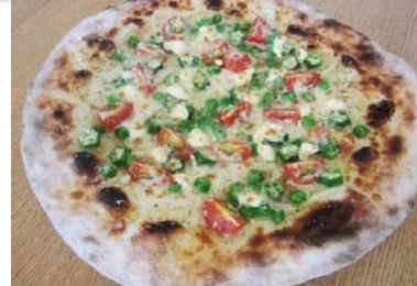
緑野菜と3種のチーズ