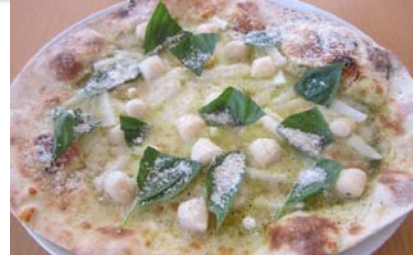
小柱&長芋 Scallop & yam